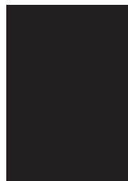
鳥山石燕 画図百鬼夜行全集