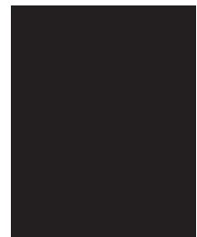
Kanaval: Vodou, Politics and Revolution on the Streets of Haiti